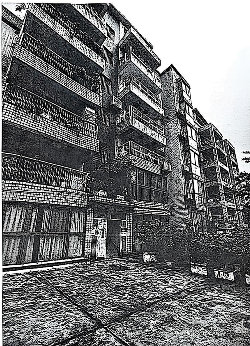
图 1-1 九龙坡区西彭镇铝城北路 5 号星光名都 18 栋 2 单元外观

九龙坡区西彭镇铝城北路 5 号星光名都 18 栋 2 单元位于重庆市九龙坡区，房屋主体结构设计合理使用年限为 50 年，结构设计基准期为 50 年；该房屋主体结构外观图见图 1-1。